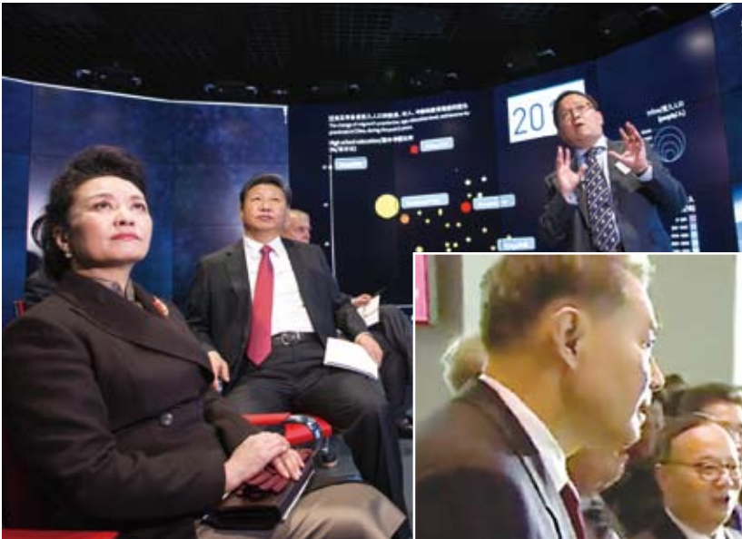
国家主席习近平参观“浙大—帝国理工学院应用数据科学联合实验室”