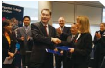
两校签署新的合作意向书