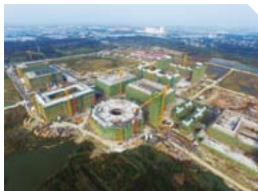
一期工程主体结构工程结顶

2015年11月3日，东区书院甲、综合体育馆，以及湖东综合体区域中的图书信息中心、文理学院、学生商业街通过了主体结构验收。至此，一期工程主体结构工程已全面完成并通过验收。同一天，二期基础工程期基坑围护正式开工建设。截至2015年12月底，一期工程已全面开始室内外安装工程和装饰工程施工，外墙清水砖砌筑已完成约40%，室外市政及景观绿化单位已陆续进场施工。二期工程已基本完成临时设施搭建，东区书院乙已开始地下室底板钢筋绑扎、砖胎膜砌筑等施工。