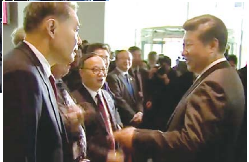
金德水书记、宋永华常务副校长向习主席汇报