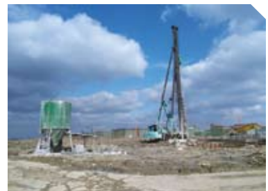
二期基础工程开工建设