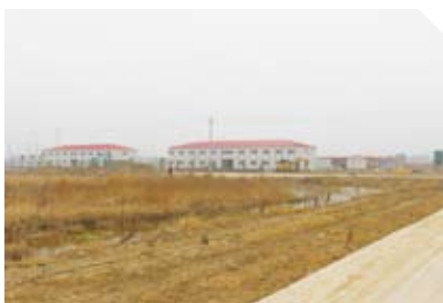
施工项目部临时设施搭设基本完成

拌桩已完成约5%；二期工程已完成试桩施工和静载检测工作，为二期桩基设计优化提供依据。全面施工的各项工均有序展开。