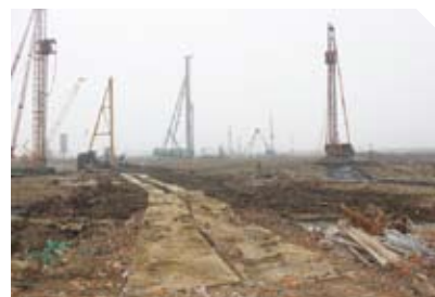
一期工程基坑围护施工