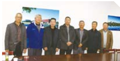
海宁校建办与监理单位双方代表合影

两家中标单位均是在各自领域达到国内一流水平的企业，在资源、管理和项目经验上均有较大优势。目前，两家公司均已按照海宁校建办的工作要求落实人员设备，进场全面开展工作。