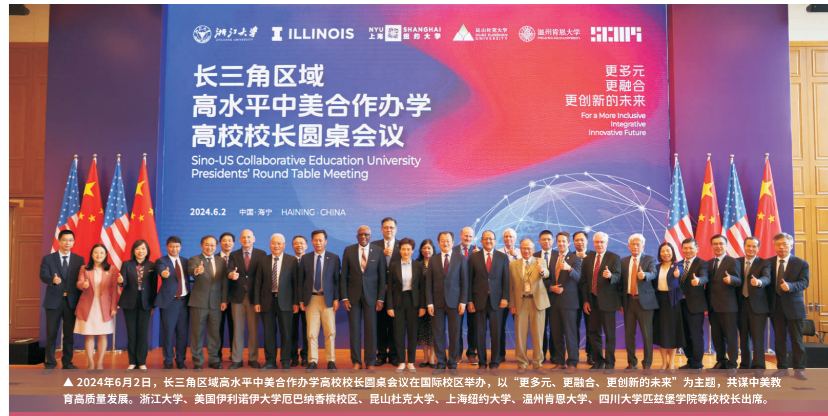
▲ 2024年6月2日，长三角区域高水平中美合作办学高校校长圆桌会议在国际校区举办，以“更多元、更融合、更创新的未来”为主题，共谋中美教育高质量发展。浙江大学、美国伊利诺伊大学厄巴纳香槟校区、昆山杜克大学、上海纽约大学、温州肯恩大学、四川大学匹兹堡学院等校校长出席。