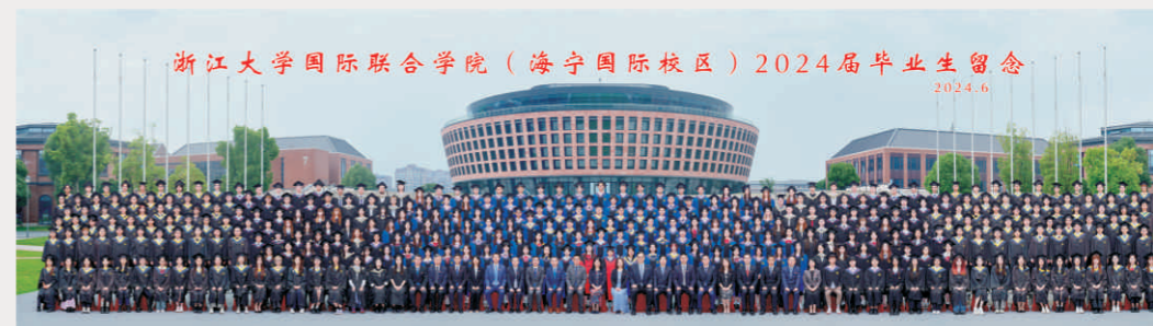
浙江大学国际联合学院（海宁国际校区）2024届毕业生留念 2024.6