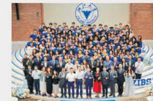
奔跑吧 追光的ZIBSer：2024届毕业生仪式