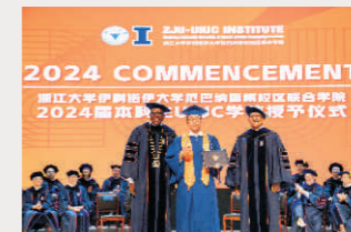
2024届UIUC本科生学位授予仪式