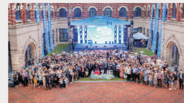
青春闪耀 璀璨启航：ZJE 2024届毕业生晚会