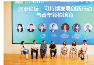
圆桌论坛：可持续发展创新行动与青年领袖培育

恰逢第53个世界环境日、第10个中国环境日，国际校区携手美国绿色建筑委员会、专家学者及师生社团等，围绕17个联合国可持续发展目标和国家“双碳”气候行动目标，贯彻落实浙江大学《可持续发展行动计划》（Z4G计划），举办可持续校园与未来论坛，共同研讨人才培养、科学研究、校园建设、社会服务等方面的经验做法和积极举措，培育弘扬生态文化，鼓励更多师生践行可持续发展理念，为共赢绿色可持续未来汇聚“世界力量”，为构建人类命运共同体贡献“浙大智慧”。