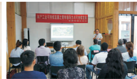
世界环境日活动：林产业可持续发展之青年领导力与可持续发展