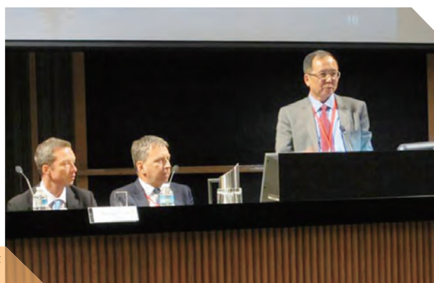
林建华校长在APRU校长年会上发表演讲