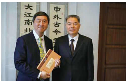
访问香港中文大学