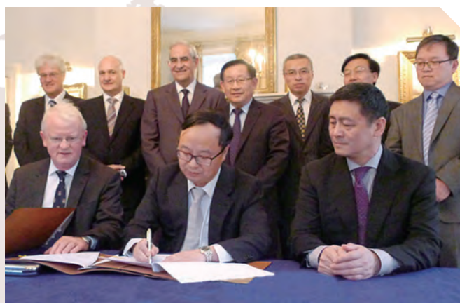
“应用数据科学联合实验室”成立签约仪式

校党委常委会原则通过浙江大学与英国帝国理工学院合作谅解备忘录，2013年5月15日，两校签署了合作谅解备忘录。