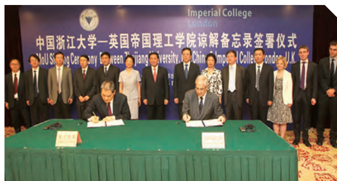
浙江大学与帝国理工学院签署谅解备忘录